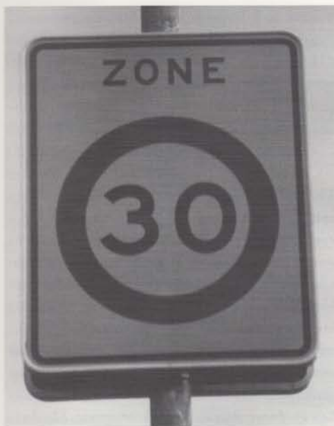
Handhaving 30 km-zones: dure drempels en wijkagenten of burentoezicht?

niet de voorkeur verdienen boven kosten voor verkeersdrempels en wijkagenten? In het algemeen zijn gemeenten die ernst willen maken met een lokale Agenda 21 afhankelijk van een grotere betrokkenheid van bewoners. De basis voor duurzame ontwikkeling is namelijk sociale ontwikkeling, is bewonersparticipatie. Het is een kwestie van vrijwilligheid en van sturing daarvan.